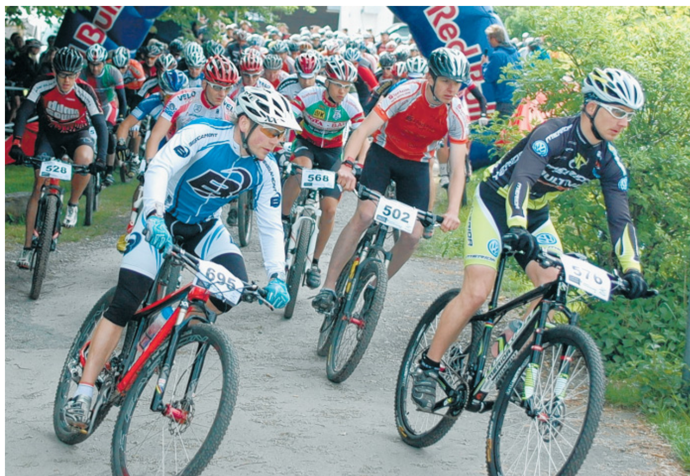
Es geht los: Start der Mountainbike Saison mit dem Race to Sky in Boffzen. 160 Fahrer nahmen beim Marathon teil.

Genauere Informationen zum Wettkampf können unter www.djk-brakel.de , Rubrik „Leichtathletik“ gefunden werden.